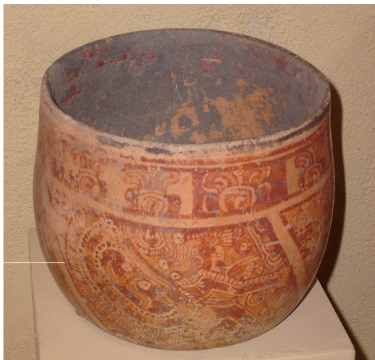
کاسه قدیمی مایایی مربوط به دوران کلاسیک که در هندوراس بدست آمده‌است.

آثار معماری مایاها که تا به امروز بجای مانده عمدتاً مبتنی بر ساخت منازل شهری و روستایی، کاخ‌های شاهی و معابد و هرم‌های مذهبی - عبادی و سامانه‌های شهری مانند کانال‌ها و مخازن آب، راه‌های شهری و بین شهری می‌شد. خیابان‌ها عمدتاً بصورت سنگفرش بودند و برای طراحی شهر مهندسان امر ابتدا نقشه شهر را طراحی کرده و سپس نظر مساعد شاه را می‌گرفتند. [52] معمولاً ساختمان‌های