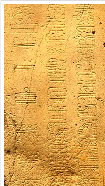
تاریخ نگاری و ثبت تاریخ در دستگاه شمارش طولانی بروی یک سنگ زرد رنگ