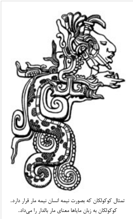
تمثال کوکولکان که بصورت نیمه انسان نیمه مار قرار دارد. کوکولکان به زبان مایاها معنای مار بالدار را می‌داد.