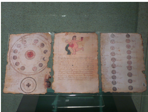
نسخه‌ای از کتاب اساطیری چیلام بالام به خط و زبان مایایی.