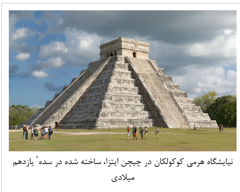
نیایشگاه هرمی کوکولکان در چیچن ایتزا، ساخته شده در سدهٔ یازدهم میلادی

این مرحله که عصر طلایی مایا محسوب می‌شود، از ۲۵۰ تا ۹۰۰ میلادی بود و در آن مایاها به اوج عظمت و درخشش خود رسیدند. دولت-شهرهای بزرگ پدید آمد و شهرهایی مانند تیکال ساخته شد. در آن دوران تخمین زده می‌شود که نزدیک به دو میلیون تن در محدوده مایانشین به سر می‌بردند که یکصد هزار تن از آنان ساکن شهر تیکال بودند. [19] بیشتر بناهای ساخته شده، بجز خانه‌ها و امکانات شهری نظیر آبراهه‌ها، به بناهای عظیم و فاخر مذهبی مربوط می‌شد. شهرهای باشکوهی مانند کوبان، چیچن ایتزا، تیکال، تنوتیهواکان و پالنکه در منطقه یوکاتان پدید آمد. [20] در این دوره بکارگیری طلا در مناسبت‌های مذهبی و نیز جهت آرایش و تزیین رایج بوده‌است. [21]