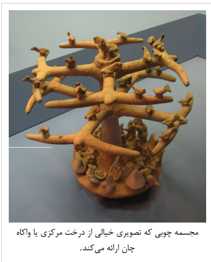
مجسمه چوبی که تصویری خیالی از درخت مرکزی یا واکه چان ارائه می‌کند.

سبک تفکر مذهبی مایاها کاملاً از عقاید مذهبی جهان قدیم متفاوت بود. بیشتر متون قدیمی این دین از میان رفته و برای همین شناخت ایدئولوژی مایاهای قدیم سخت و تا اندازه زیادی مبتنی بر حدس و گمان است. دین در جامعه مایا عامل متحد کننده محسوب می‌شد و همه طبقات از پادشاه تا بردگان همگی درگیر یک دین بودند. [77] حکومت‌ها همیشه مذهبی و دین‌گستر بودند و برای همین سرپیچی از باورهای دینی یا بدعت در آن خشم حاکمان را بر می‌انگیخت. دین اگرچه تمام مسائل زندگی مایا را در برمی‌گرفت اما به همان اندازه هم عرفانی بود و به مسائل معنوی می‌پرداخت. مذهب سنتی مایا خدایان متعددی داشت و هر خدا نیز یک همزاد غیر همجنس به عنوان همدم برای خود داشت که پس از مرگ او را در زیبالبا یا دنیای زیرین پذیرا می‌شد تا زمانی که دوباره زنده شده و به آسمان بازگردد. [78] هنوز نیز گروه‌هایی از مردم مایایی تبار ساکن هندوراس، گواتمالا و مکزیک به باورهای قدیمی مایایی معتقدند و مذهب فاتحان اروپایی خود را به‌طور کامل نپذیرفته‌اند. [79]