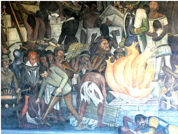
سوزاندن متون کهن مایا توسط کلیسای کاتولیک و تاتر مایاها از این حادثه.