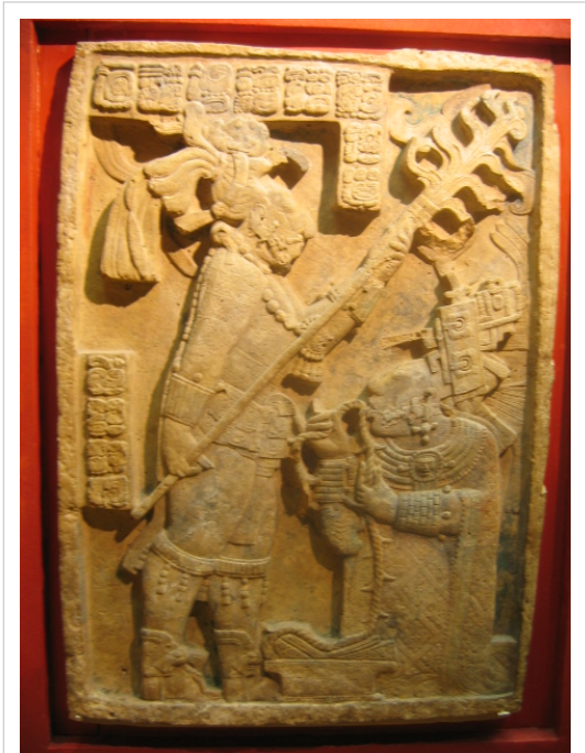
پادشاه مایایی یا کسچیلان به همراه همسرش در دیوارنگاره‌ای با نقوش برجسته که در موزه بریتانیا نگهداری می‌شود. همسر او در حال بریدن زبانش است تا خون خود بر زمین بریزد. این نوعی قربانی غیر جانی برای شاه به شمار می‌آمد.

جامعه مایاها از قبایل به هم پیوسته‌ای که در سده‌های پیش از میلاد بتدریج گرد هم آمده بودند، تشکیل می‌شد و فرهنگ در روستاها و شهرها اگرچه با هم در تضاد بود اما وجود نظام شاه-خدایی در این کشور موجب قرابت فرهنگ، زبان و مذهب ساکنان قلمرو مایا شده بود که در پی این گونه فرهنگ عمومی و کلی در اجتماع مایاها پدید آمد. [35] در نظام مایاها طبقه اجتماعی، بسیار مهم تلقی می‌شد و هر کس می‌بایست جایگاه خود را از نیاکان به ارث ببرد. شاه در راس همه قرار گرفته و سلسله مراتب نیز بشدت رعایت می‌شد. [36] مایاها در شهرها بر حسب طبقاتی که داشتند امرار معاش می‌کردند. مهم‌ترین مشاغل در جامعه مایا مشاغل مذهبی و کاهنی، افسری ارتش، کاتبی، بایگانی، مهندسی ساختمان و بازرگانی بود. در کنار این مشاغل طبقات پائین‌تر مشاغلی مانند کارگری ساختمان و صنعت‌گری داشتند که کیفیت تولیدات آن‌ها به حدی بود که بنظر می‌رسد این افراد به صورت تخصصی آموزش دیده بودند. شغل‌های دیگر مردم در جامعه مایا عبارت بود از کشاورزی و فعالیت‌های خدماتی در شهر مانند آشپزی و نظافت و خدمتکاری که معمولاً نسب افراد در احراز هر یک از این مشاغل بسیار موثر بود. [37]