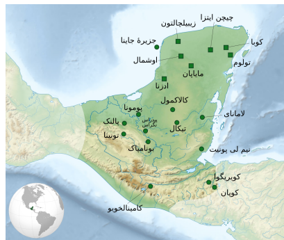
نقشه‌ای از تمدن مایا

آثار به جای مانده از شهر تاریخی اوچمال که در سده هشتم میلادی در اوج شکوفایی بود. بیشتر این بناها پس از متروکه شدن در دل جنگل‌های انبوه پوشیده شدند و در قرن بیستم بیشتر آن‌ها از میان جنگل‌های یوکاتان در کشور مکزیک و گواتمالا بیرون آورده شد.