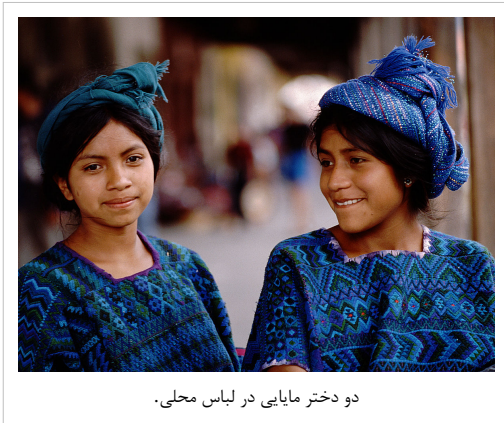
دو دختر مایایی در لباس محلی.