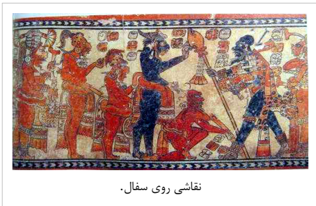
نقاشی روی سفال.

نقاشی از دیگر جنبه‌های تمدن مایایی بود که شیوه آن تا به امروز نیز میان جوامع مایایی بر جای مانده‌است. [58] نقاشی‌ها بیشتر بر روی پارچه و دیواره‌ها صورت می‌گرفت که گاهی با گچبری نیز توأم می‌شد. [59] رنگ آبی نیلی میان مایاها جنبه الهییت داشت و رنگی که در نقاشی‌های خود استفاده می‌کردند، از نوع ماندگار آن بود که تجزیه نشده و از بین نمی‌رفت. رنگی که بر روی پارچه بکار می‌بردند، طی فرآیندی پیچیده و شیمیایی بدست می‌آمد و امروزه پژوهشگران از طریق آزمایش‌های شیمیایی به روش بایئات کردن این رنگ‌ها پی برده‌اند که هنوز نیز پس از گذشت قرن‌ها ماندگاری و درخشندگی خود را حفظ کرده‌اند. [60] مایاها همچنین در زمینه نقاشی با ابداعاتی که در زمینه رنگ‌آمیزی و گچبری داشتند، تغییراتی را در نحوه ساخت پرستشگاه‌ها در آمریکای باستان ایجاد کردند. به این نحو که پرستشگاه‌های مایایی علاوه بر ساخت پلکانی دارای طرح‌ها و نقاشی‌های رنگی به همراه گچبری نیز بودند که معمولاً تجسم خدایان و نیای شاهان مایایی بود. [61]