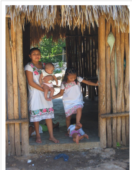
یک خانواده روستایی مایا در یوکاتان مکزیک.

مایاها بخشی از گروه‌های قومی کشور مکزیک هستند که بیشتر آنها در نواحی جنوبی و بویژه شبه جزیره یوکاتان ساکن می‌باشند. [149] زبان مایاها می‌قیم مکزیک یوکاتک است که ریشه مایایی دارد و مذهب پیشین جمعیت مایایی ساکن مکزیک کاتولیک می‌باشد. جمعیت مایاها می‌قیم مکزیک حدود سیصد و پنجاه هزار تن می‌باشد که بیشتر آن‌ها اسپانیایی را بعنوان زبان دوم یا زبان نخست خود می‌دانند. دلیل شرایط جغرافیایی محل سکونتشان بیشتر مایاها مکزیک از صنعت توریسم امرار معاش می‌کنند. [150]