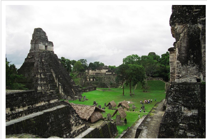
مرکز شهر تیکال در اوج قدرت خود در دوران کلاسیک مایا

گمانه‌زنی دربارهٔ زمان ورود مایاها به آمریکای مرکزی به حدود قرن دهم پیش از میلاد معطوف می‌شود و نخستین نشانه‌های استقرار و سکونت بومیان در اکتشاف‌های باستان‌شناسی مربوط به ۲۶۰۰ پیش از میلاد در کشور بلیز تعیین شده‌است. [10] تقویم مایایی به ۳۱۱۴ پیش از میلاد اشاره دارد و البته یک داستان قدیمی پذیرفته شدهٔ مایایی نیز، حوادث ۱۸۰۰ پیش از میلاد را توصیف کرده‌است. در دوران آغازین پیدایی مایاها آن‌ها ابتدا از نواحی شمالی آمریکا به سمت جنوب آمدند و با سکونت در ارتفاعات گواتمالا تمدن عظیمی را بوجود آوردند. تاریخ تمدن مایاها به سه دورهٔ پیشاکلاسیک، کلاسیک و پساکلاسیک دسته‌بندی شده‌است. [11]