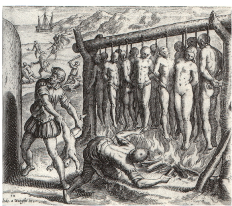
مایاها که فاقد سلاح گرم بودند، بصورت گسترده به اسارت اسپانیایی‌ها در می‌آمدند و گاهی اوقات نیز بطرز فجیعی قتل‌عام می‌شدند.

دوران پساکلاسیک تمدن مایا از ۹۰۰ میلادی تا قرن شانزدهم که زمان ورود مهاجمان اسپانیایی بود را دربرمی‌گیرد. [23] مایاها در یکی از سربه‌مهرترین رویدادهای تاریخی به طرز مرموز و ناشناخته‌ای ناگهان تمام سرزمین‌های متمدن و آباد خود را ترک کرده و به کوهستان‌ها پناه بردند. دلیل این کوچ ناگهانی مشخص نیست که چگونه شد که شهرهای باشکوه و عظمت مایاها ناگهان خالی از سکنه شد. [24] فرضیه‌های گوناگونی نظیر شیوع بیماری واگیر یا حملات مهاجمان بدوی و نیز باورهای مذهبی مطرح شده‌است اما هیچ یک تاکنون مورد تأیید واقع نشده‌است. [25] مایاها که از سده نهم میلادی رو به افول گذارده بودند یک به یک شهرهای خود را ترک می‌کردند و به گوشه‌هایی از جنگل‌ها پناه می‌بردند. اگرچه فقدان آثار ادبی و از میان رفتن متون مایایی باعث دشواری علت‌یابی این پدیده شده اما باتوجه به محتوای کتاب سنتی و متاخر چیلام بالام می‌توان به هراس و یاسی که در جامعه مایا بر حسب یک پیشگویی پدید آمده بود، اشاره کرد. این هول و هراس در یک قطعه قدیمی و سنتی که در این کتاب آمده نمود پیدا می‌کند. [26]