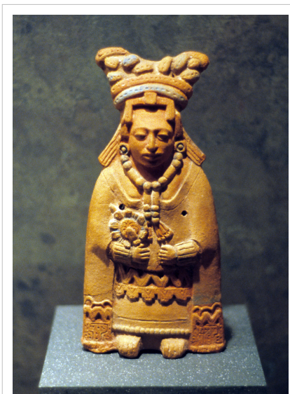
مجسمه سفال زن مایایی.

از سایر هنرهای تجسمی مایاها می‌توان سفالگری را که از ویژگی‌های بارز هنر مایایی است، برشمرد. در خلال دوران کلاسیک مایاها شروع به تولید آثار سفالی چندرنگی کردند که بیشتر جنبه تزئینی داشت تا کاربرد روزانه. این سفالینه‌ها که عمدتاً به گونه جام یا کاسه و یا مجسمه‌های سفال هستند، رنگ‌آمیزی شده و دارای نقش‌ها و طرح‌هایی هستند که نمادهایی اساطیری و ایدئولوژیک را از باورهای قوم مایا ارائه می‌کند. [62] رنگ آبی سفال‌ها نشان از کاربرد آن در امور مذهبی را دارد. [63] نقاشی‌های رمزگونه‌ای بر روی بیشتر سفالینه‌های بدست آمده مایایی دیده می‌شود که گاهی با کنده‌کاری همراه هستند. رنگ آمیزی سفالینه‌ها گاهی پیش از بختن آن انجام می‌گرفت و گاهی پس از آن. از آنجایی که مایاها چرخ سفالگری نداشته‌اند، با صرف وقت زیاد با نوک انگشتان تکه‌های گل را تبدیل به کاسه یا کوزه می‌کردند. روش کار آن‌ها از لوله کردن گل و دادن شکل مارپیچ به آن‌ها بوده‌است. [64] دوره زمانی سفالینه‌های بدست آمده از مایاها به حدفاصل قرن ششم پیش از میلاد تا قرن نهم میلادی مربوط می‌شود. [65] بجز سفالگری پیکرتراشی مایاها نیز از دیگر جنبه‌های هنری تمدن مورد نظر است. مجسمه‌هایی که در دوره مایاها ساخته شده، بیشتر مجسمه شاهان و یا خدایان و موجودات مافوق بشری را شامل می‌شود. برخی از این مجسمه‌ها سنگ یشم سبز که جنبه قدسی داشته ساخته شده بودند و کشف میزان زیادی از محصولات یشم در کنار گورهای بزرگان مایا موید این نکته می‌باشد. [66] تندیس‌های مایاها معمولاً بصورت نیم‌تنه و نشسته و به ندرت ایستاده‌اند و در سردر سراها و نمای ساختمان‌ها معمولاً بچشم می‌خورند. [67]