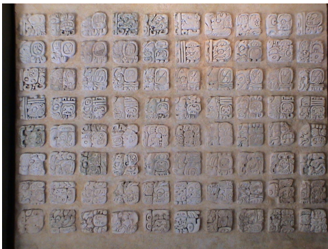
سنگ نوشته‌ای به خط مایایی که در شهر پالانکه کشف شده است.