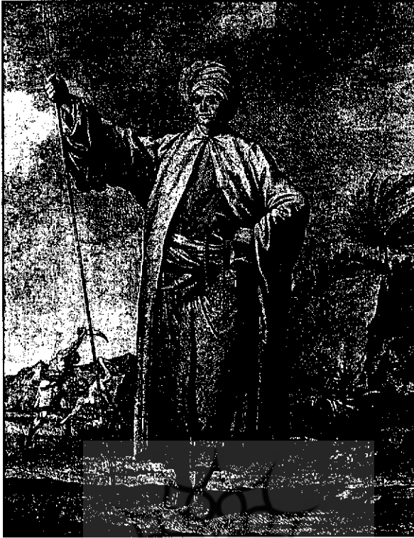
● کارستن نیبر (1733-1815) Gaarsten Niebuhr