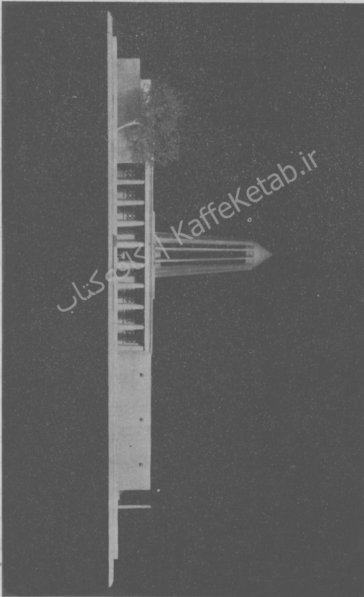
آونگاه بوعلی - نمای اصلی بظرف خیابان بوعلی (ماکت)

ویرتیکال آون (۷۵:۲۰) و همالزوم و همک به آن نامظنه و به معنی آون است