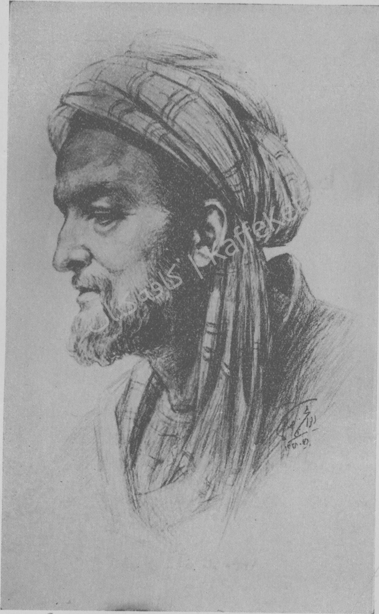
تصویر ابوعلی بن سینا . (بتصویر انجمن آثار ملی) اثر خامه ابوالحسن صدیقی